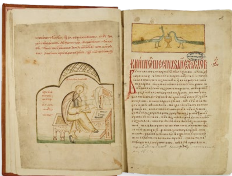
Шестоднев свт. Василия Великого. Последняя четверть XV в. Полуустав. Собрание рукописных книг Иосифо-Волоцкого монастыря в Фонде Свято-Троицкой Сергиевой Лавры

Иоанна Златоуста: не можешь быть в добродетели как Солнце, будь как Луна; не можешь быть Луной, будь яркой звездой. Если же не можешь быть звездой яркой, будь слабой, но только на небесах. Луна знаменует собой Ветхий закон и светит ночью, когда нет иного небесного освещения; когда же восходит Солнце, лунный свет уже не требуется. Смена лунных фаз — это знамение воскресения мертвых.