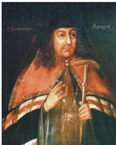
Архиепископ Холмогорский Афанасий (Любимов). Парсуна. Конец XVII — начало XVIII в.

тра Первого. Известно, что Петр, по крайней мере, трижды посещал владыку в Холмогорах и принимал от него помощь на строительство в Беломорье оборонительных укреплений. По Двинской летописи известна и еще одна встреча царя с архиепископом Афанасием, состоявшаяся в Москве в Великий пост 1697 года, на которую царь пришел «в ночи не со многими своими ближними людьми», то есть это была ночная беседа «один на один», на которой, очевидно, обсуждались весьма секретные вопросы. Чего хотел Петр, можно только предполагать, но известно, что в 1701 году из-под пера владыки Афанасия вышло сочинение