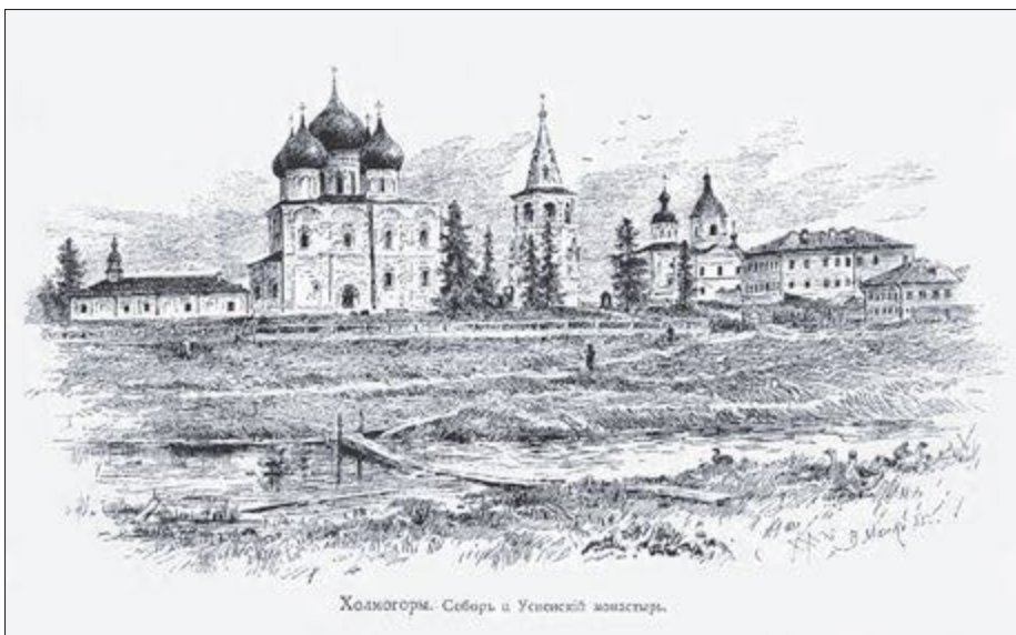
Холмогоры. Собор и Успенский монастырь.

Собор и Успенский монастырь в Холмогорах. Иллюстрация из книги К. К. Случевского «По Северо-Западу России» в 2-х томах. СПб, 1897