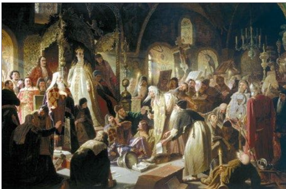
Никита Пустосвят. Спор о вере. Худ. Перов В. Г. 1880–1881 гг. Собрание ГТГ. На полу изображен архиепископ Афанасий, на щечке которого Никита «запечатлел крест»

В этой связи можно попытаться предложить несколько новый взгляд на еще одно произведение владыки Афанасия — на его «Шестоднев». Это сочинение до сих пор не имеет точной датировки и обращало на себя внимание исследователей лишь эпизодически.