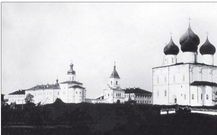
Центр Холмогор с кафедральным Спасо-Преображенским собором на старой фотографии

если оба рога серпа одинаковой величины, но северный рог «чистее», то будет ветер с запада. «Почернение» и помутнение Луны предвещает дождь и так далее.